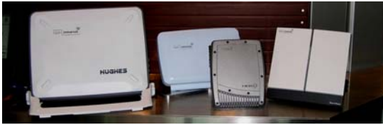
Os diferentes tipos de terminais BGAN